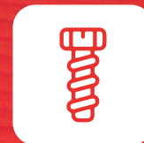
Servicios transversales para la industria

7 sectores representados en una plataforma integral diseñada para generar negocios reales.