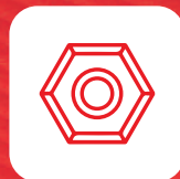
Ferretería y bricolaje