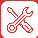
Herramientas y dotaciones