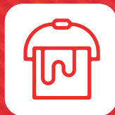
Pinturas y terminados