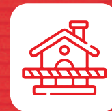
Construcción y albañilería